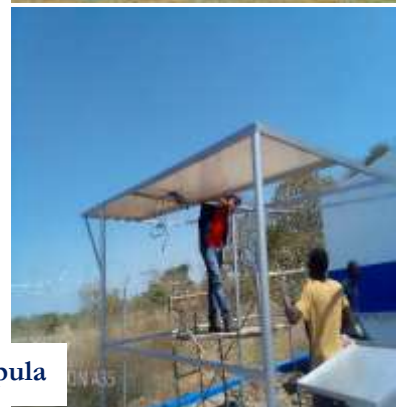
Imagens 3: Ilustração de Obras de Construção de SAA's Fiscalizadas (Vila Nova, Mahundzulukane, Roroge, Convide, Goba e Chazia).