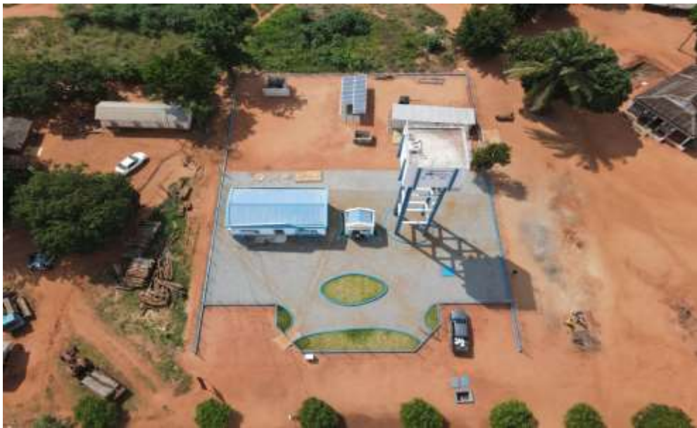
Imagens 2: construção de 5 sistemas de abastecimento de água com sistema de dessalinização na Província de Tete (A-I).