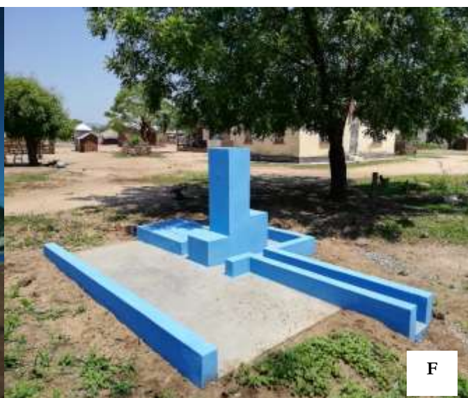
Imagens 1: Ilustração de depósito elevado (betão, e metálico) e casa de gestão (A e D), depósito apoiado e casa das bombas (B), montagem da estrutura do depósito elevado e o painel solar (C e D). Fonte de captação e casa de comando (E), e fontanário (F)