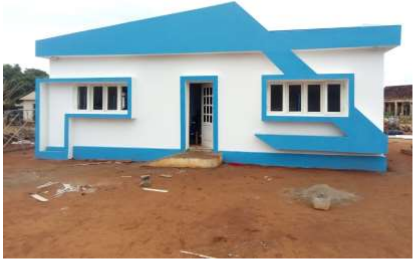
Imagens 4: Ilustração de obra de construção de SAA em curso