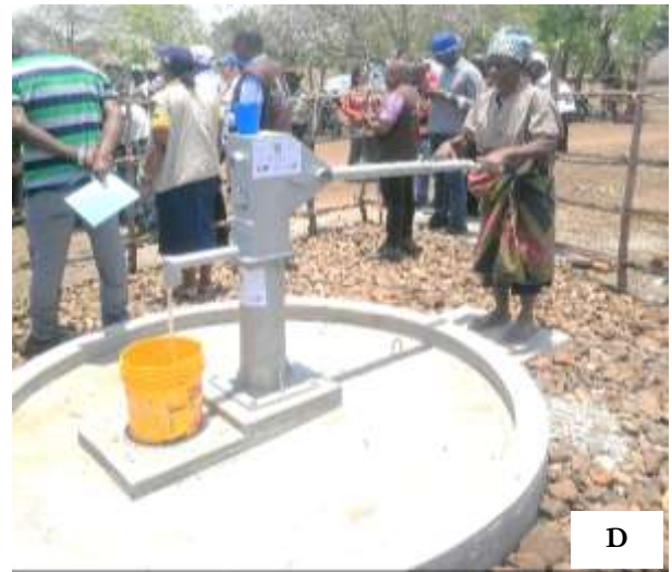
Imagens 6: Fiscalização de trabalhos de construção de furos de abastecimento de água, a saber, Análise de temperatura, TDS e Condutividade (A) Ensaio de caudal de furo (B). Montagem de bomba manual Afridev (C), Inauguração de Fonte com bomba manual (D).