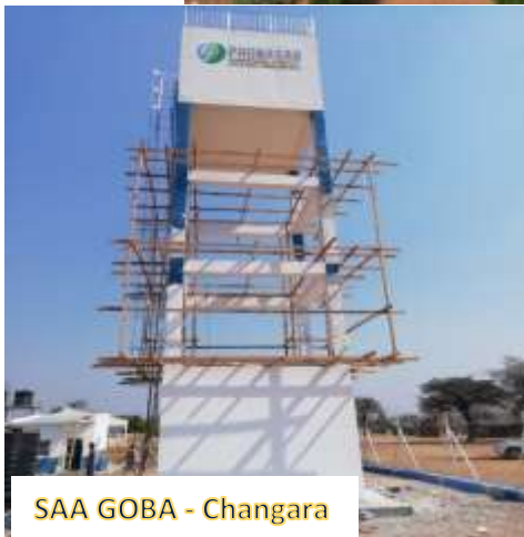
SAA GOBA - Changara