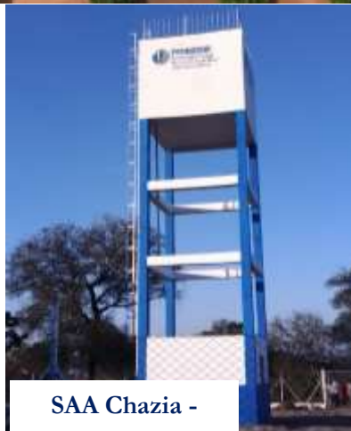
SAA Chazia -