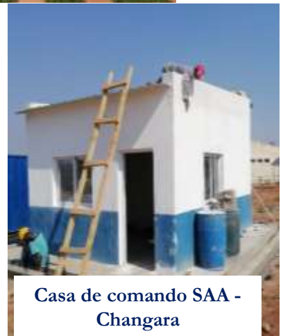
Casa de comando SAA - Changara