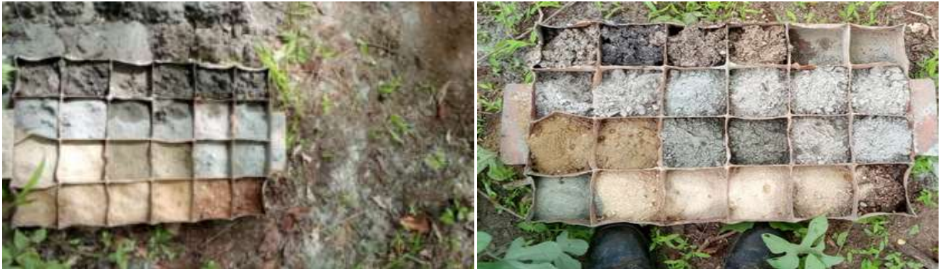
Imagens 5: Fiscalização de trabalhos de construção de furos de abastecimento de água, a saber, perfuração e desenvolvimento do furo. Testemunho de sondagem das litologias atravessadas durante a perfuração.